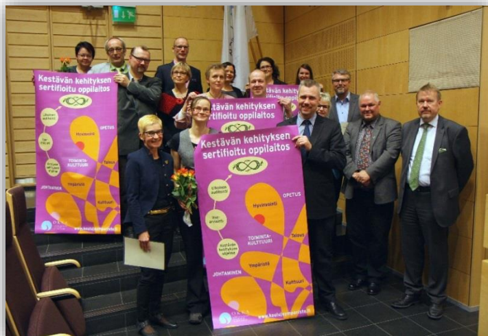
Ensimmäiset keke-sertifioidut vapaan sivistystyön oppilaitokset yhteiskuvassa